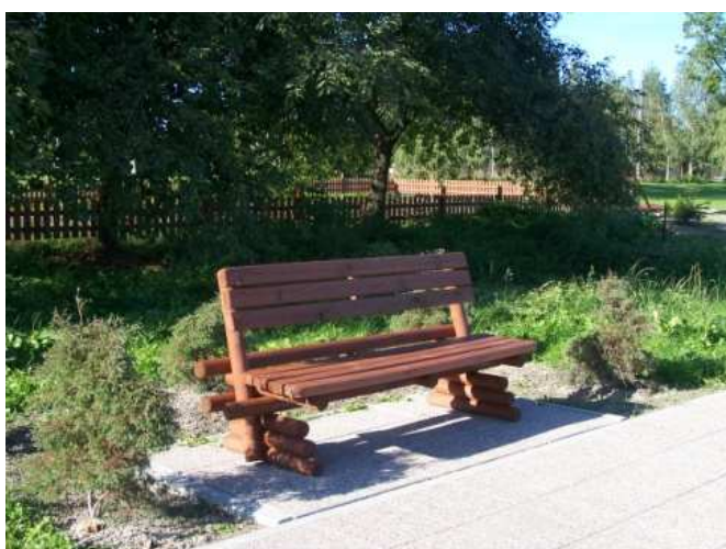
Fragmenty parku wiejskiego