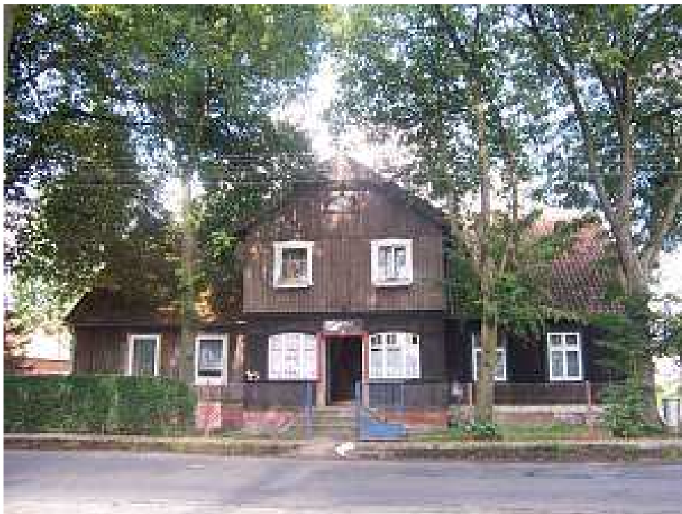
Dom podcieniowy z początków XIX w.