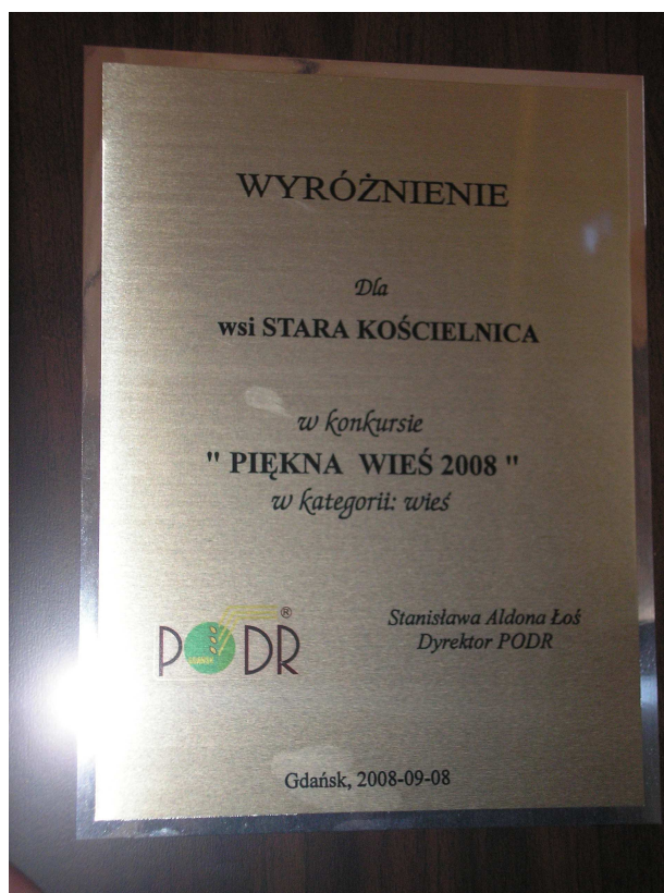
Wyróżnienie w konkursie wojewódzkim „Piękna Wieś Pomorska”.