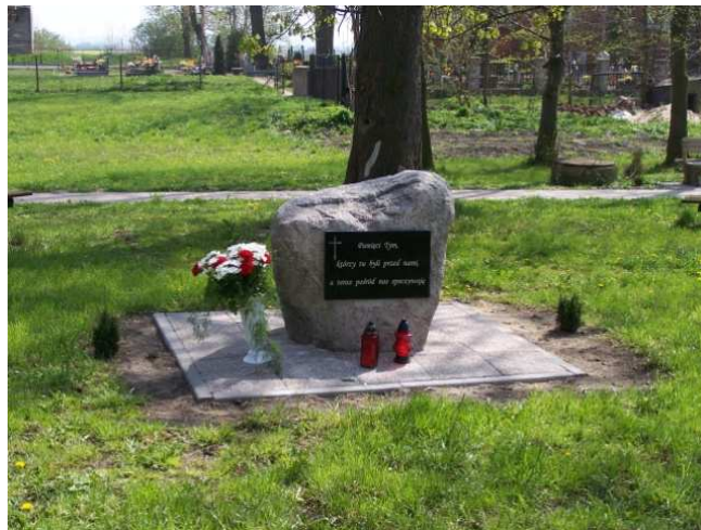
Kamień pamiątkowy poświęcony byłym mieszkańcom wsi

W okresie międzywojennym wieś znalazła się w granicach Wolnego Miasta Gdańska. Zamieszkiwała ją głównie ludność pochodzenia niemieckiego, która po zakończeniu II wojny światowej opuściła Starą Kościelnicę. Obecni mieszkańcy to w 100% ludność napływowa, przesiedleńcy z kresów II Rzeczypospolitej i Polski Centralnej.