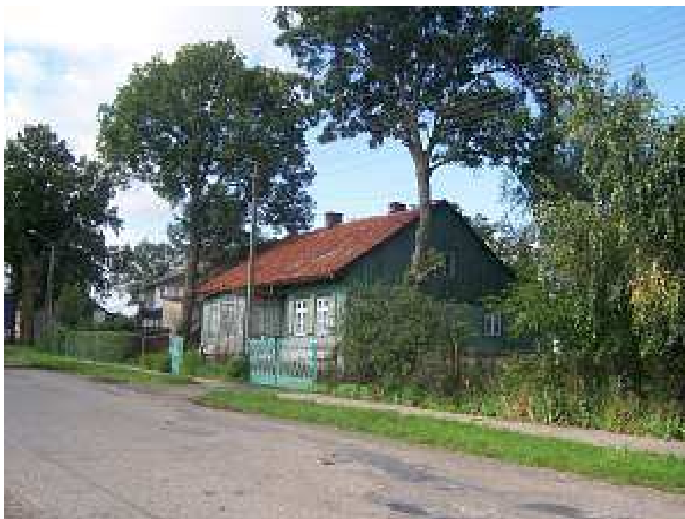
Budynek mieszkalny z przełomu XIX i XX w.