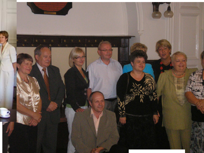
Wręczenie nagród dla najpiękniejszych wsi i zagród powiatu malborskiego