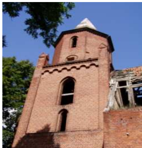
ruiny kościoła w Gnojewie z XIV wieku