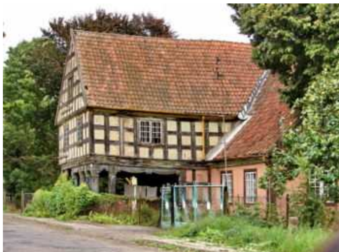
Dom podcieniowy we wsi Bystrze