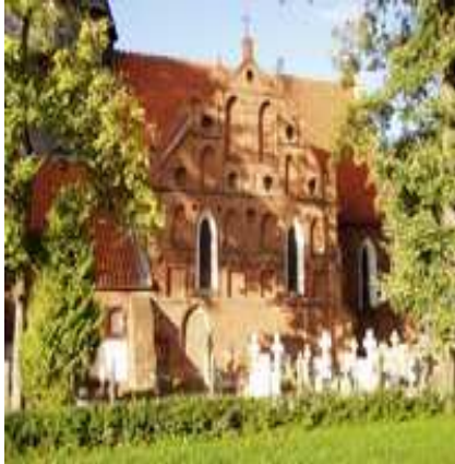
Kościół w Starej Kościelnicy

Krajobraz gminny jest zdeterminowany przez jej wiejski charakter. Podstawowe walory, jakie mogą być wykorzystane to uroki krajobrazu, równinna rzeźba terenu, czyste powietrze, spokój tradycje historyczne.